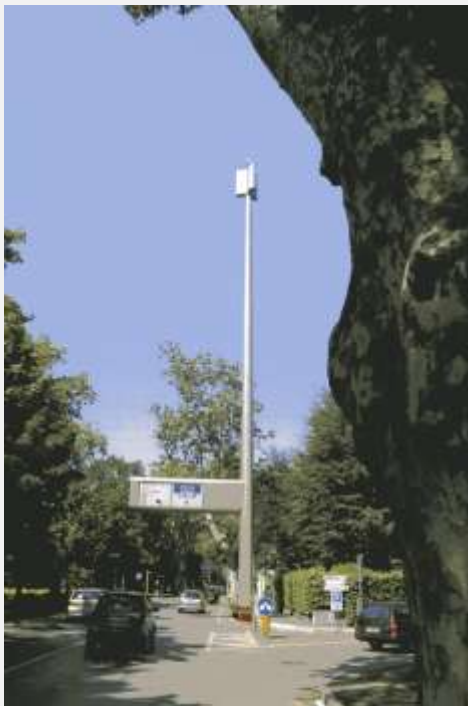
Zone Neutre Installazione di antenne su palo con elementi per la mimetizzazione