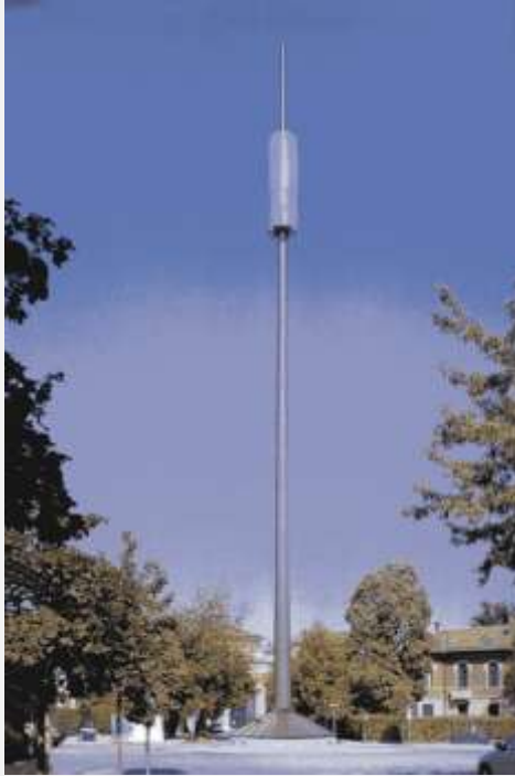
Zone Neutre Installazione di antenne su palo costituente arredo urbano