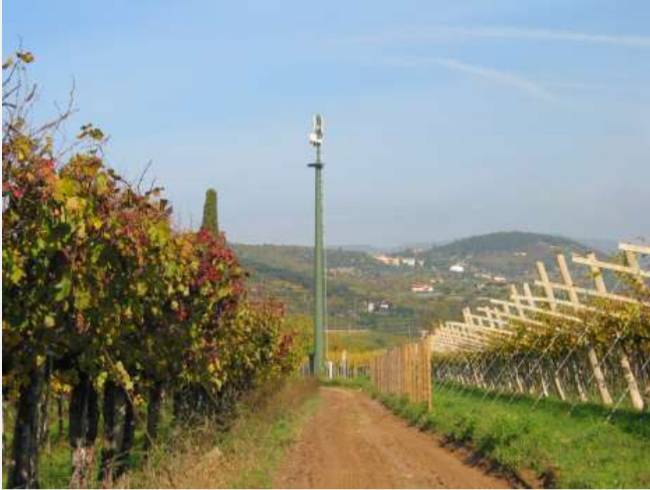
Zone Neutre Installazione di antenne su palo mimetizzato