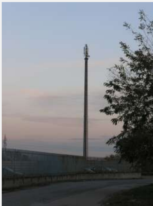
Zone Neutre Installazione di antenne su palo e co-siting