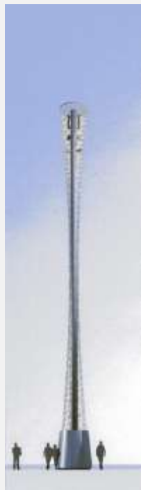
Zone Neutre Installazione di antenne su palo costituente arredo urbano