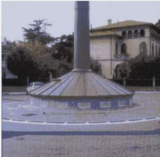
Zone Neutre Shelter mimetizzato