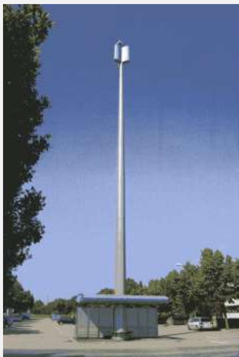
Zone Neutre Installazione di antenne su palo con elementi per la mimetizzazione