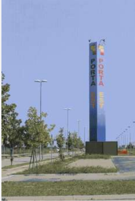
Zone Neutre Installazione di antenne su palo mimetizzato